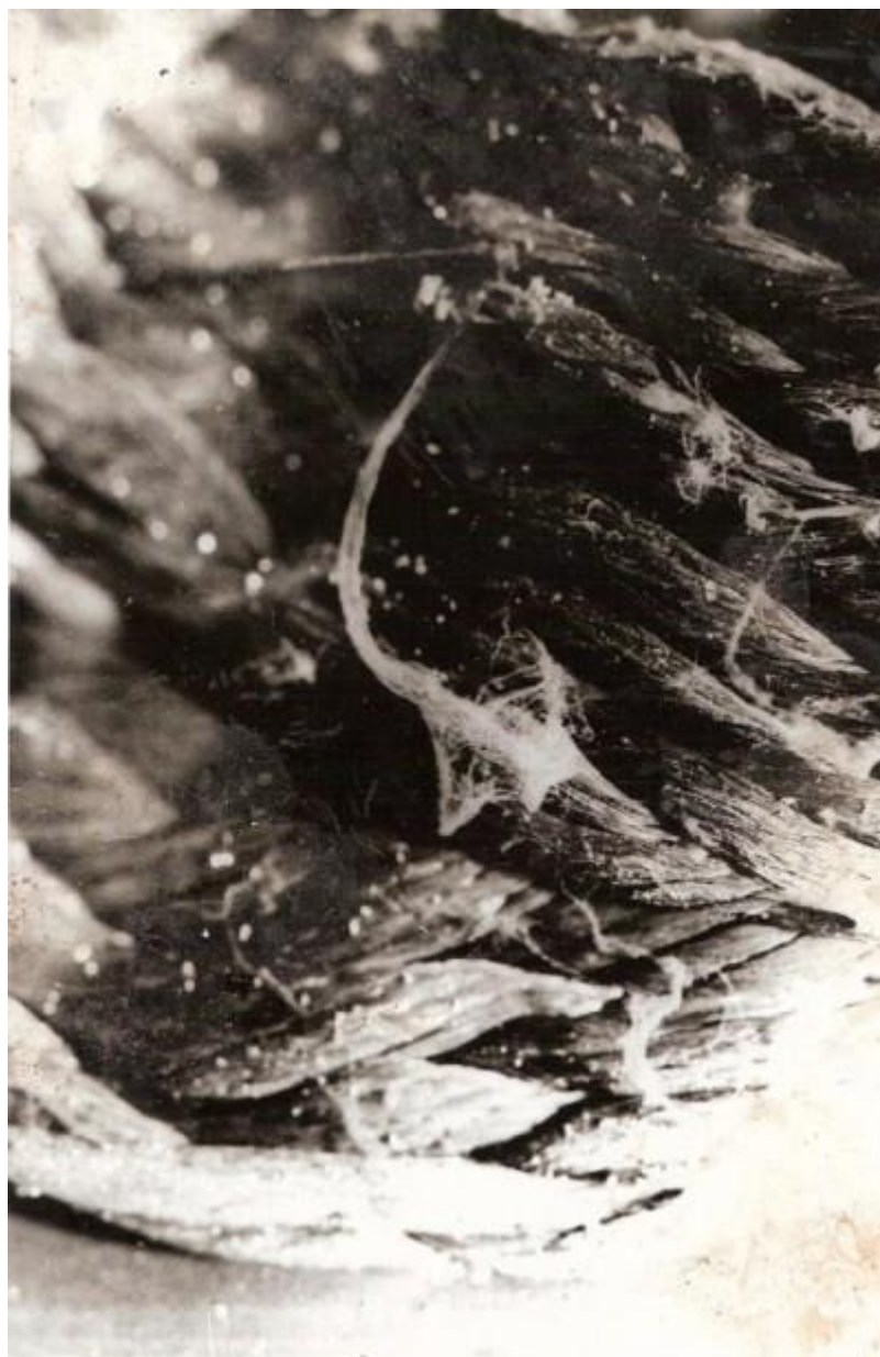
Фото 2. Паутина из нитей аморфного вещества.